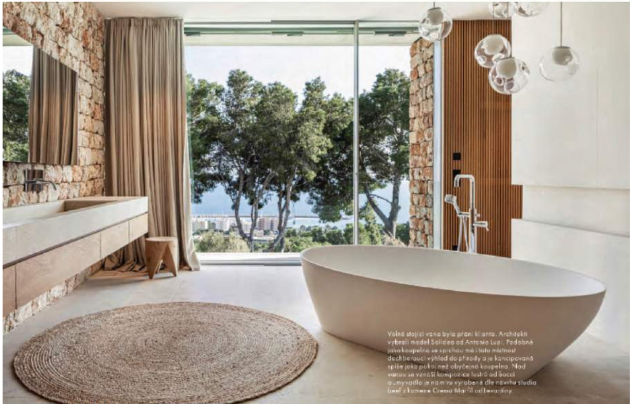
Volná stojící vana byla přání klientů. Architekti vybrali model Solidea od Antonio Lupi. Podobně jako koupelna se i architekti máli tuto místnost dach bez oceli, výhled do přírody je koncipovaná spíše jako pokoj než obytná koupelna. Nad vanou se vznášejí kompozice lustřů od Jacca a Lumyrdillo je namísto vyrobená dle návrhu studia Inter a kamenné Crema Marfil od Levantina.