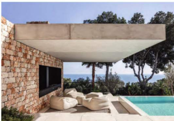
Široký pozemek se nachází v oblíbené vilové čtvrti a výhled má rámovat čtyřmi vzrostlými borovicemi, do kterých se klienti okamžitě zamilovali. Každý z celkem deseti kusů kamenů bylo třeba vylébat a ručně opracovat z velkých balvanů, také proto se stavba protáhla na více než dva roky. Před ní se nachází sada pufů Float od značky Paola Lenti.

s jemným dřevěným rástrem, skrze něž může volně proudit vzduch a vytvářet ty pravé středomořsky ostré stíny. Dřevo, konkrétně pak především dubové, uvnitř změkčuje surové plochy betonu a kamene a dodává bydlení útulnost a hřejivé odstíny. Jinak velmi střídmé pojetí interiéru je zapříčiněné řadou zabudovaných funkcí. Na jejich pozadí jsou vystavěné scény z početně vybraných solitérů od světově známých, ale i českých a slovenských značek jako Brokis, Flexform, Paola Lenti, Davide Groppi nebo Living Divani. Zdánlivě dokonale prostředí záměrně narušuje vápenná omítka „estuco de cal“, která v autentickým domům na Mallorce zkrátka patří. Na nepravidelnou notu s řemeslným přesahem hrají také svítidla nad jídelním stolem, vyrobená speciálně pro projekt slovenským keramickým studiem sí. li ceramics a manufakturu modranska podle představ architektů. Jemná nerovnosti jsou další vrstvou zdůrazňující kontext, ve kterém se vila nachází, a pomáhají zprostředkovat místní kolonit. „Nechtěli jsme anonymní dům, který může stát kdekoli na světě, ale vyzelovaný prototyp, který bude mít upřímný vztah k lokální kultuře a zároveň klientům padne jako ulitý,“ shrnuje Buzinkay. A je třeba říct, že tento úkol se podařilo splnit na jedničku.