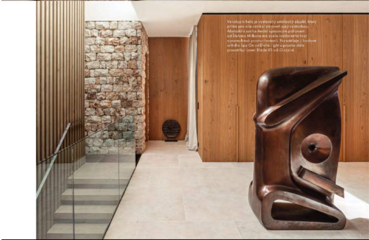
Ve vstupní hale je vystavený umělecký objekt, který přimá pro vlnu vzniká zároveň s její výtvarnou. Abstraktní socha Anidál spádově poháněná od Stefano Millova má zcela indiferentní tvar a zomeřuje prostou formou. Na vlně je i bodové světlo Spy On od Della Tigli a prostor dále prosvětlují luster Blade XS od G. Scuzzi.